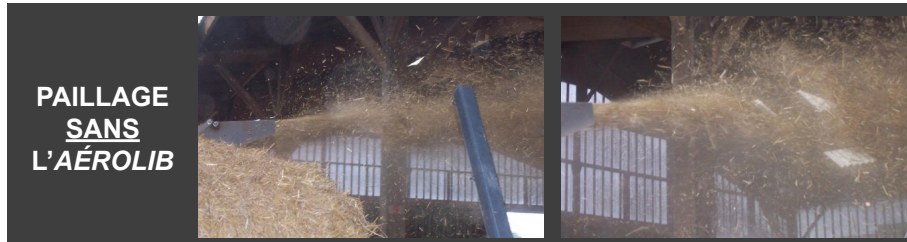
PAILLAGE SANS L'AÉROLIB

Ce système de brumisation de paille est fixé sur les pailleuses, désileuses-pailleuses et mélangeuses pailleuses EUROMARK au niveau de la goulotte de paillage. Le débit est réglable à volonté et permet de diffuser un micro-brouillard d'eau. Ce fin brouillard « plombe » la poussière et l'immobilise au sol avec la paille (ce procédé n'entraîne aucune variation d'humidité dans le bâtiment).